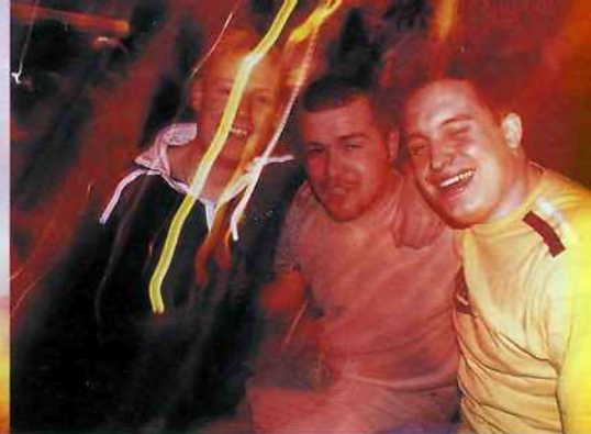
Diskotéky na základních školách a dětských táborech – na to se vzpomíná rádo

prázdné oči drogovaných lidí. Tahle zábava je svým způsobem legrační a nemůžete jí brát moc vážně, ale zábava to je. Kdo chce, může tu objevit i vzdělávací aspekt celé věci – vidět, jak se dělaly klipy a jak moc se za dejte tomu dvacet let vyvinuly technologie.