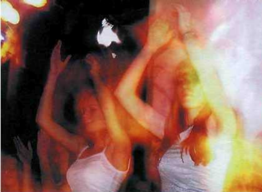
Party je o tom, že ve své hlavě vypnete okruhy, které se starají o vaši image kritického krasoducha. Jinak to nejde.