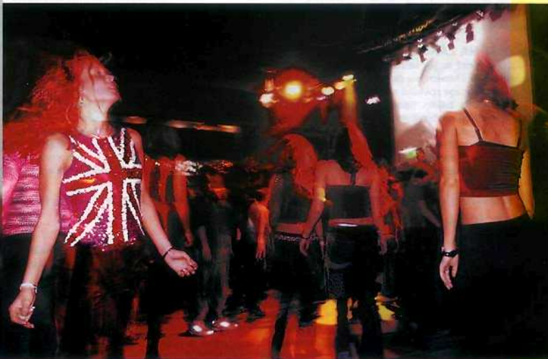
Extáze a podobné „životabudíče“ na 80's parties nefčí ...

balí jsme společné známé a na plát- no jsme se dívali jen tehdy, když znělo něco dost „nezávislého“ (U2, Depeche Mode, R.E.M. ...). Asi aby- chom se neshodili jeden před dru- hým. Usoudila jsem, že k pochope- ní fenoménu 80's Party je třeba prožít večer naplno. Z jednoho na- rvaného baru jsem vytáhla sedm známých z jedné reklamní agentury ve věku mezi dvaceti a osmadvaceti s tím, že zjistím, co s nimi Futurum udělá. Nikdo z nich nikdy na 80's Party nebyl a zas tak strašně po-